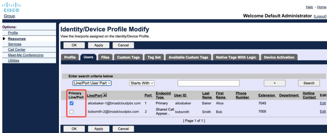
Primaire lijn-/poortconfiguratie voor identiteit/apparaatprofiel in de beheerportal

Vanaf versie 43.2 wordt een nieuwe configuratieoptie ( beperving apparaateigenaar ) toegevoegd om te bepalen of de primaire profielbeperving moet worden toegepast. Deze kan worden gebruikt om de Webex-toepassing toe te staan een niet-primair lijn-/poortprofiel te gebruiken om zich aan te melden bij de telefoonservices. Deze configuratieoptie wordt toegepast voor alle configuraties, ongeacht het aantal profielen dat voor de gebruiker is geconfigureerd ( Als de beperking voor apparaateigendom is ingeschakeld en er is geen apparaat met primaire lijn/poort voor het bijbehorende platform, maken de telefoonservices geen verbinding ).